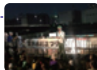
9.29 クローバー橋と旧中川川の駅で開催された水彩フェスタ。インターンの学生さんとお手伝いしました。多くの方々に賑わった素敵な水辺のお祭りでした。