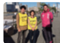
10.27 豊洲マラソン。今年も開会式から表彰式まで運営のお手伝い。お子さんも大勢参加し、多くの地元の参加者で盛り上がりました。開会式で準備体操を指導した元オリンピック選手の渡邊高博氏と。