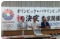
9.8 2020オリンピック東京開催決定！ 決定の瞬間を区議会・区民の皆様と祝福。