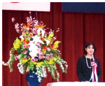
入学式・卒業式に出席