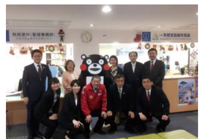
天草宝島観光協会