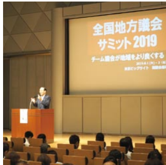
北川正恭早稲田大学名誉教授の基調講演