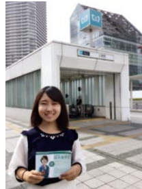
豊洲駅にて区議会レポートと一緒に配布

今までは議員という職業を一括りに見ていましたが、活動内容も人柄も本当に様々で有権者として一人一人の想いをしっかりと確認して投票したいと思いました。また、インターンを通して色々な職種の方と関わったり、マナーなどを学べた事は自分の自信に繋がりました。