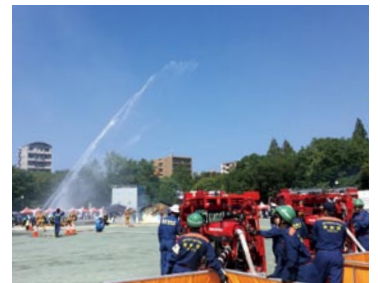
江東区総合防災訓練の様子