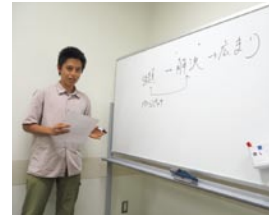
あやこcafeで自分の思いを発表