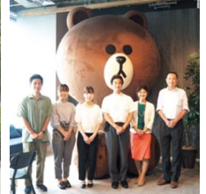
LINE株式会社視察・LINEの行政分野への活用を学ぶ