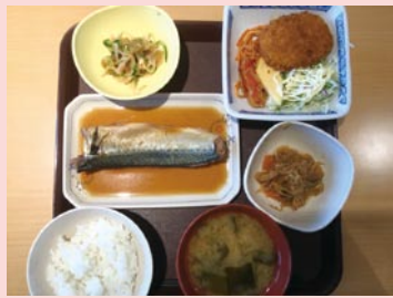
ボリュームたっぷりヘルシーなA定食